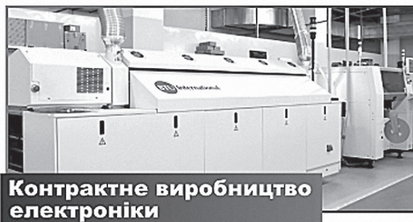
Контрактне виробництво електроніки