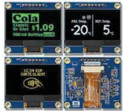
Габаритні розміри дисплея наведено на рис.1 .

Офіційний імпортер Winstar на території України є Компанія SEA, яка виконує прямі поставки та забезпечує технічну підтримку продукції. Для отримання кваліфікованої консультації або для придбання дисплеїв Winstar звертайтеся за телефоном +38 (044) 330 00 88 чи e-mail: info@sea.com.ua.